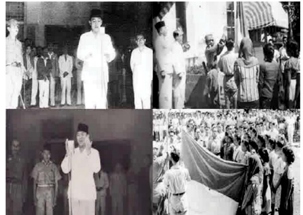
Upacara 17 Agustus 1945

Ada fakta yang untuk jangka waktu lama masih belum mantap atau masih lunak, misalnya tentang pembunuhan presiden Amerika Serikat J.F. Kennedy di tahun 60-an. Selain itu ada pula fakta keras, antara lain Proklamasi Kemerdekaan Republik Indonesia pada 17 Agustus 1945