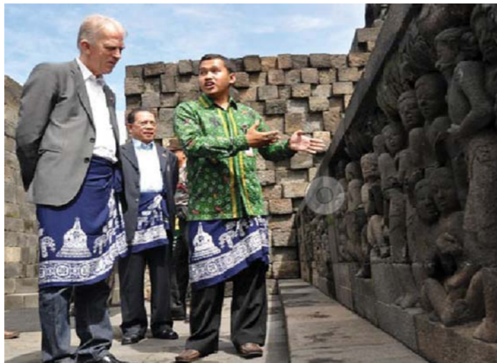
Seorang Guide menceritakan relief candi

Suatu peristiwa yang sama dapat saja dikisahkan dengan cara berbeda oleh dua orang atau lebih karena mereka memiliki penafsiran yang berbeda. Misalnya ketika kita mewawancarai orang-orang yang pernah mengalami atau melihat peristiwa Bandung Lautan Api pada 1946 akan berbeda mengisahnya antara satu dengan yang lainnya.