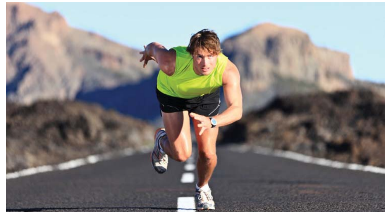
Gambar: Posisi berlari jarak pendek

Gerak lari jarak pendek karena dari awal start sampai finish mengerahkan kecepatan maksimal, gerak kaki diupayakan secepat mungkin sehingga kaki tumpuan lebih banyak telapak kaki bagian depan. Sehingga bagi pelari jarak pendek kekuatan telapak kaki bagian depan sangat penting untuk kesuksesannya.