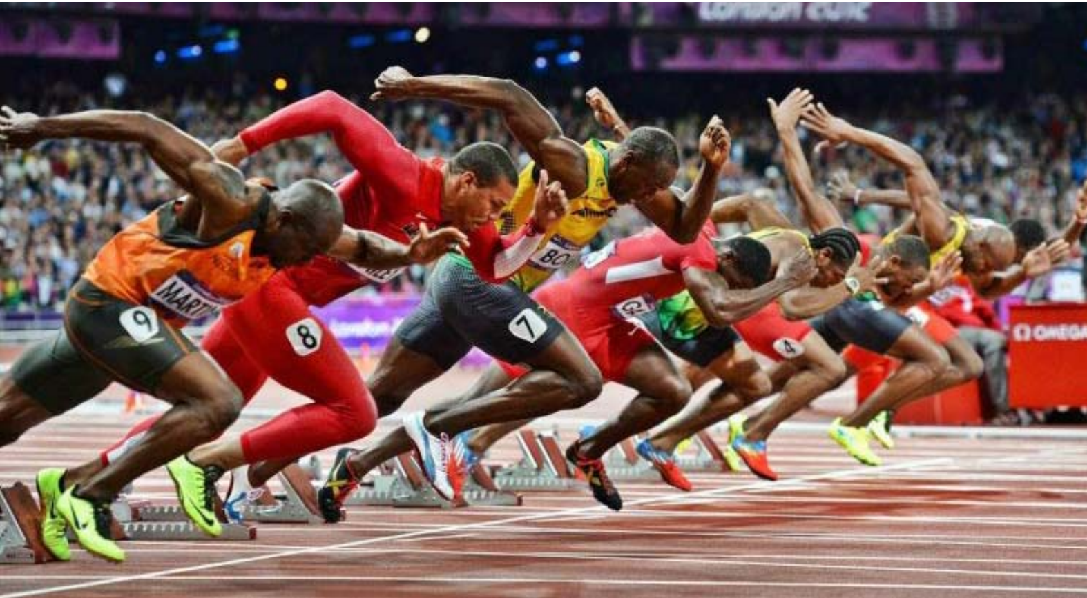
Gambar: Start lari sprint 100 meter pada sebuah kejuaraan internasional

Start lari jarak pendek dilakukan dengan start jongkok (crouching start) , yakni start yang dilakukan dalam posisi berjongkok di belakang garis start . Start jongkok dilakukan untuk memperoleh kecepatan optimal sejak awal lari. Start jongkok memberikan tolakan kaki dan daya dorong ke depan lebih besar sehingga menghasilkan kecepatan yang lebih maksimal. Start jongkok jarang dilakukan oleh seorang pelari untuk lari jarak jauh, karena untuk lari jarak jauh tidak membutuhkan kecepatan maksimal pada saat awal lari.