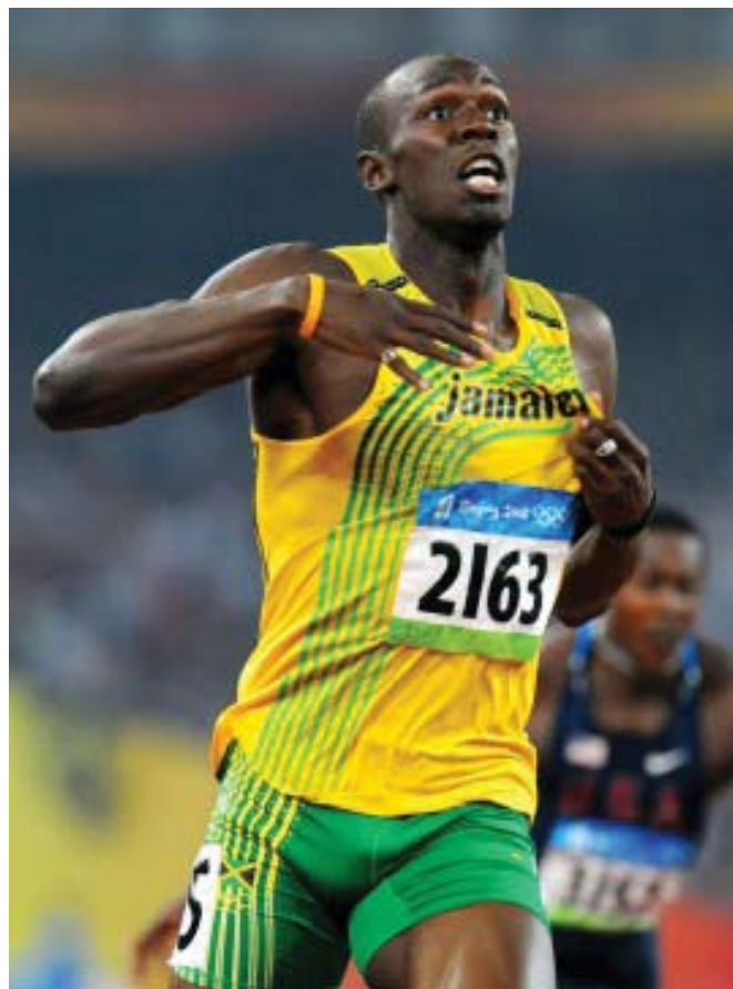
Gambar: Usain Bolt (Jamaika) Pemegang Rekor Dunia Lari 100 meter Putra

Pelari-pelari tingkat dunia untuk nomor lari 100 meter putra waktu tempuhnya sudah berada di bawah 10,00 detik, dan untuk putri