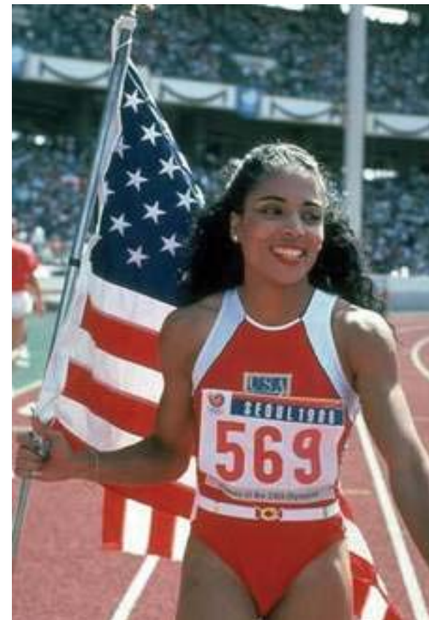
Gambar: Florence Griffith Joyner (USA) Pemegang Rekor Dunia Lari 100 meter Putri

di bawah 11,00 detik. Rekor dunia lari 100 meter putra saat ini dipegang oleh Usain Bolt dari Jamaika dengan catatan waktu 9,58 detik yang diciptakan pada 16 Agustus 2009. Rekor dunia lari 100 meter putri atas nama Florence Griffith Joyner dari Amerika Serikat dengan waktu 10,48 detik yang dicetak pada 16 Juli 1988. Sedangkan rekor nasional lari 100 meter putra adalah 10,17 detik atas nama Surya Agung Wibowo yang ditorehkan pada tahun 2009. Rekor nasional putri atas nama Irene Joseph dengan torehan waktu 11,77