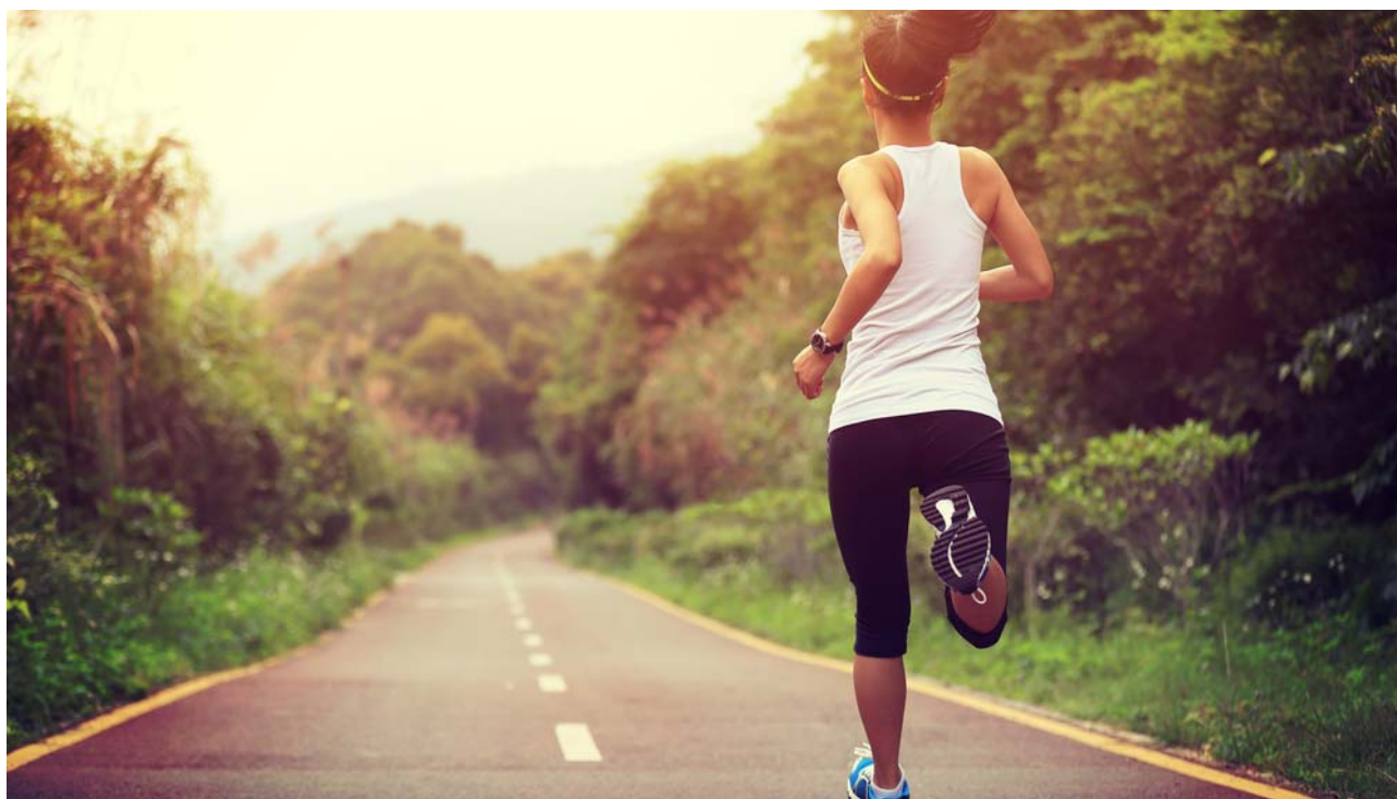
Gambar: Posisi berlari jarak jauh

Gerak lari jarak jauh dan menengah, menggunakan tumpuan kaki hampir seluruh telapak kaki, dan posisi badan relatif tegak. Kekuatan seluruh telapak kaki harus dilatih. Yang terpenting pada lari jarak menengah dan jauh adalah disamping kemampuan teknik gerak lari adalah daya tahan dan stamina untuk berlari dengan konsisten dalam jarak yang cukup jauh. Bahkan bermain-main dengan kecepatan adalah salah satu strategi untuk memenangkan perlombaan, dimana hal tersebut