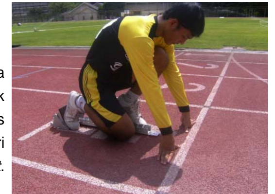
Gambar: Posisi start pada aba-aba: "Bersedia ...!"

Lutut kaki belakang diletakkan pada ujung kaki yang di depan dengan jarak satu kepal tangan. Kedua lengan lurus sejajar dengan bahu, Telapak tangan kiri (jari-jari) letakkan di belakang garis start . Pandangan lurus ke depan/lintasan.