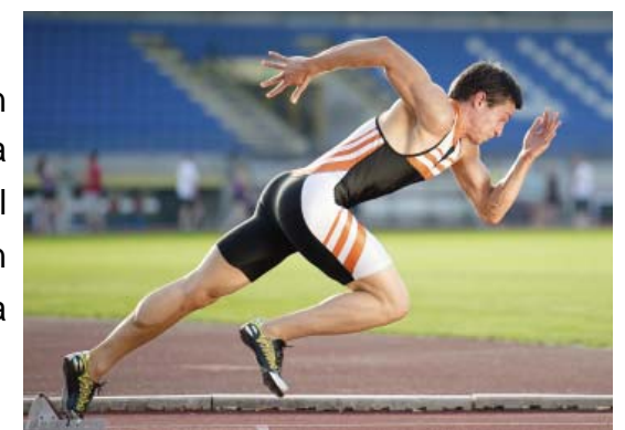
Gambar: Posisi start pada aba-aba: "Yak ...!"

Kedua kaki mendorong dengan dorongan yang eksplosif terhadap tumpuan pada start block dalam suatu sudut yang optimal diikuti dengan badan yang diluruskan dan diangkat. Langkah pertama kira-kira 45-75 cm di depan garis start .