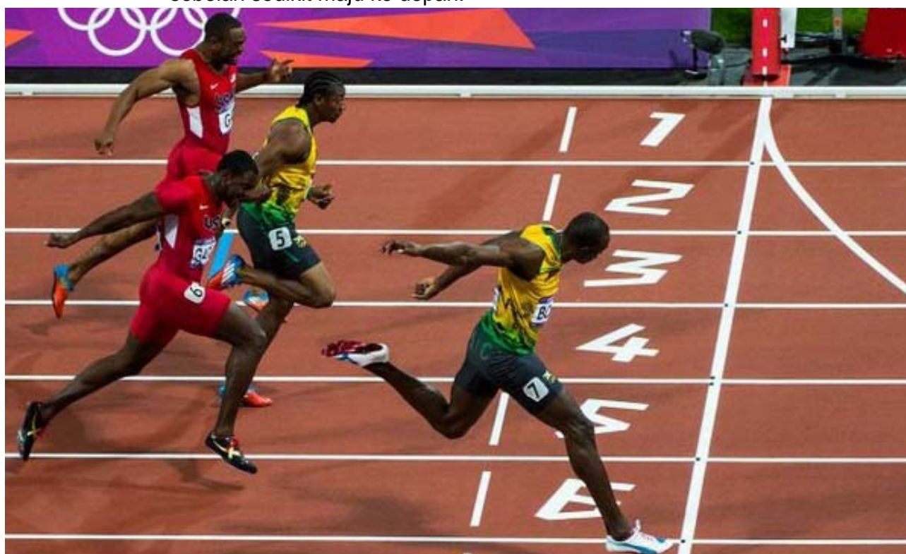
Gambar: Posisi pelari jarak pendek memasuki garis finish

Ketika memasuki garis finish, melakukan gerakan melompat adalah salah, karena dapat berakibat jatuh karena kehilangan keseimbangan dan menimbulkan cedera