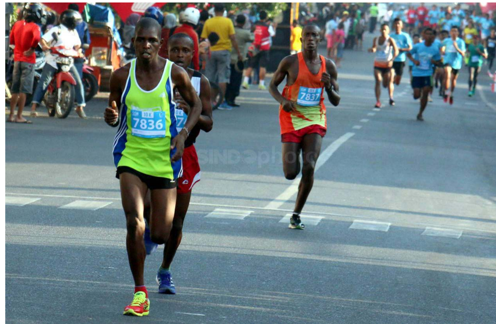
Gambar: Lomba lari jarak jauh

Pada kejuaraan resmi seperti Pekan Olahraga Nasional, SEA Games, Asian Games, Olimpiade, peserta kejuaraan adalah resmi dari perwakilan negara. Tetapi banyak