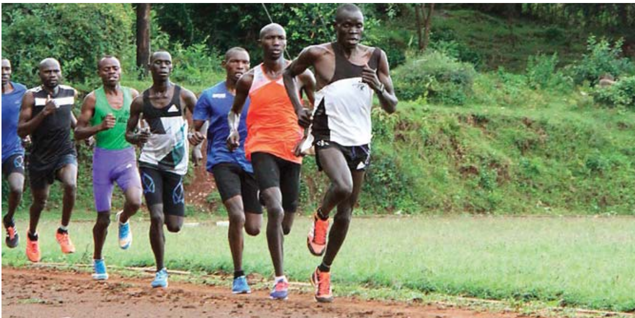
Gambar: Atlet-atlet Pelari Kenya berlatih keras di Pemusatan Latihan

Lari jarak jauh membutuhkan stamina dan daya tahan yang tinggi sehingga ritme dan teknik lari yang efektif dan tidak menguras energi penting diperhatikan. Oleh karena itu latihan untuk meningkatkan stamina dan daya tahan sangat penting sehingga dapat bertahan lari dengan kecepatan konstan dan tidak kehabisan tenaga sampai garis finish .